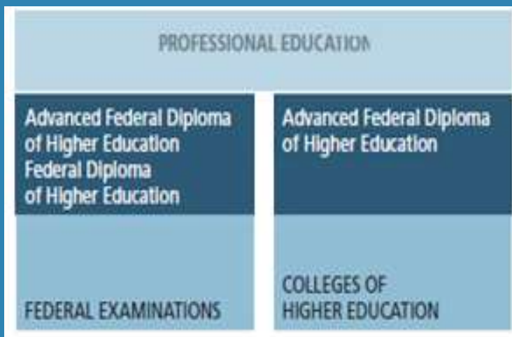
Slika 2. Model organizacije dualnog studija u Švajcarskoj